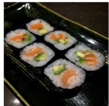
Saumon Avocat 15,00 €