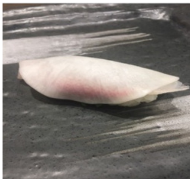
Poisson blanc recouvert d'une fine tranche de navet mariné 5,30 €