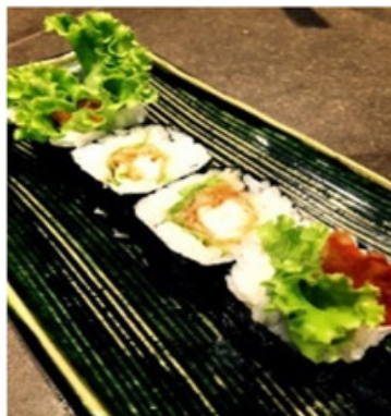
Beignet de Crevette 19,00 €