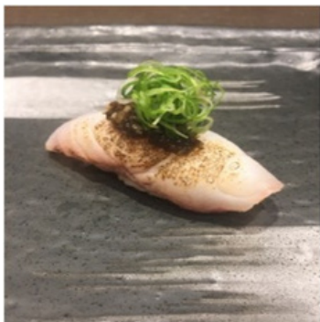
Poisson blanc mi-cuit à l'ail, sésame, algue et ciboule 5,80 €