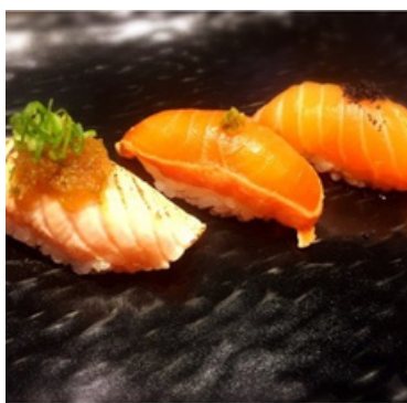
Trio Saumon 14,00 €