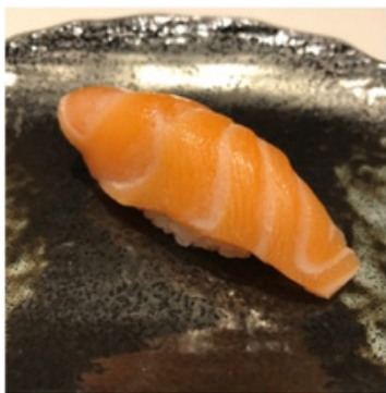
Saumon / Salmon 3,90 €