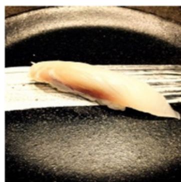
Dorade / Sea Bream 4,80 €