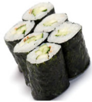
Concombre, Avocat et Sésame 10,50 €