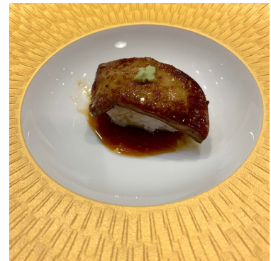
Foie Gras de Canard Poêlé 9,50 €