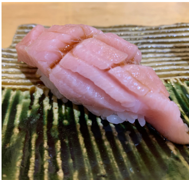
Thon Gras / Fatty Tuna 14,00 €