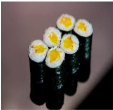
Radis Jaune et Sésame 11,00 €