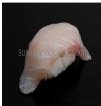
Maigre / Meagre 4,80€