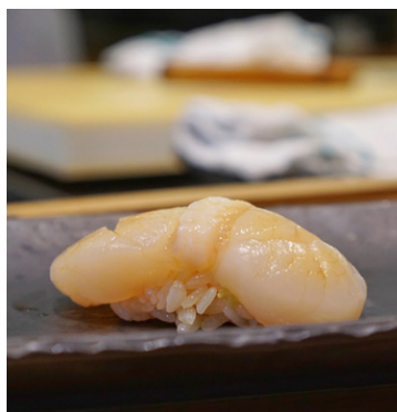
Noix de Saint- Jacques / Scallop 9,50 €