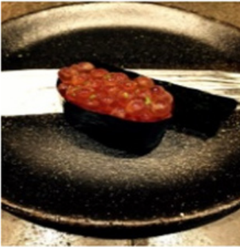
Oeufs de Saumon / Salmon Roe 9,50 €