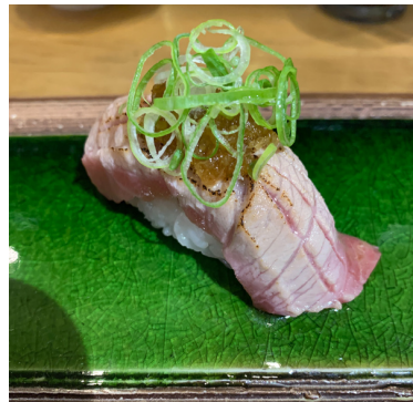
Thon Gras mi-cuit 14,50 €