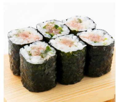
Thon Gras et Ciboule 30,00 €