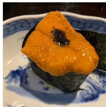
Oursin / Sea Urchin 12,00 €