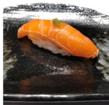
Saumon mariné associé d'une pointe de yuzu 4,80 €