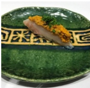
Poisson blanc et Oursin 11,50 €