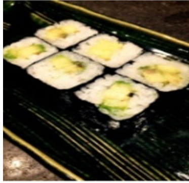
Avocat 11,50 €