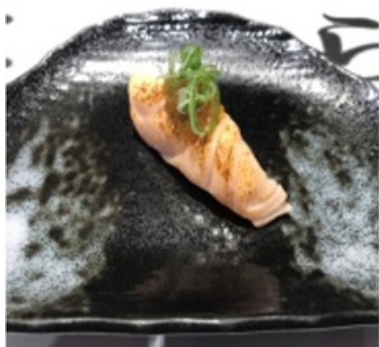
Saumon mi-cuit à la sauce ponzu et ciboule 4,80 €