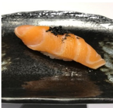
Saumon à l'huile d'olive et sel noir 4,80 €