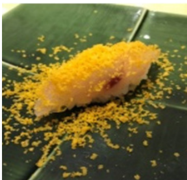
Poisson blanc à la Poutargue 9,50 €