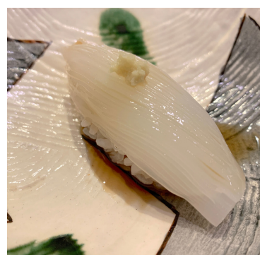
Calamar Cru / Raw Squid 8,00 €