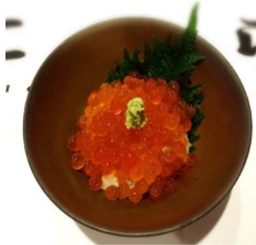
Small Ikura Donburi 20,00 €