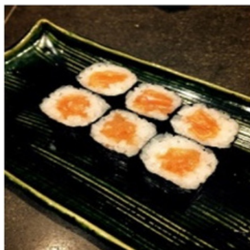
Saumon 13,00 €