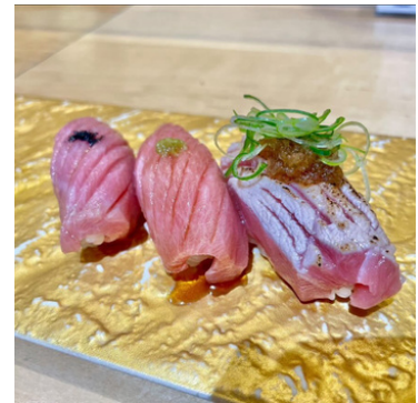
Trio Thon Gras 43,00 €