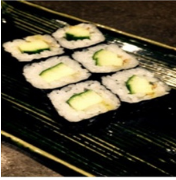
Concombre et Sésame 9,50 €