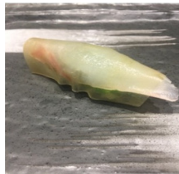
Poisson blanc à l'algue Kombu 5,80 €