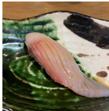
Sériole / Yellowtail 7,00 €