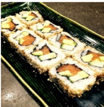
Inside-Out California Saumon 18,00 €